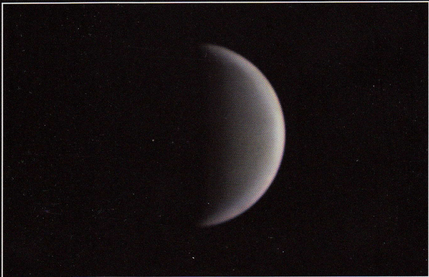
RVB 08/06/2015 19:48 TU

telescope 67 (focale 1100mm) et caméra en R, G et B.