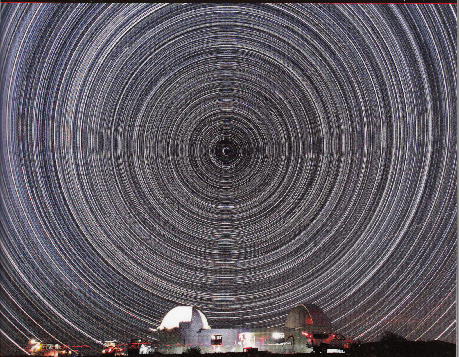
Illustration : photo P. et M. Bignone

La revue des astronomes amateurs francophones