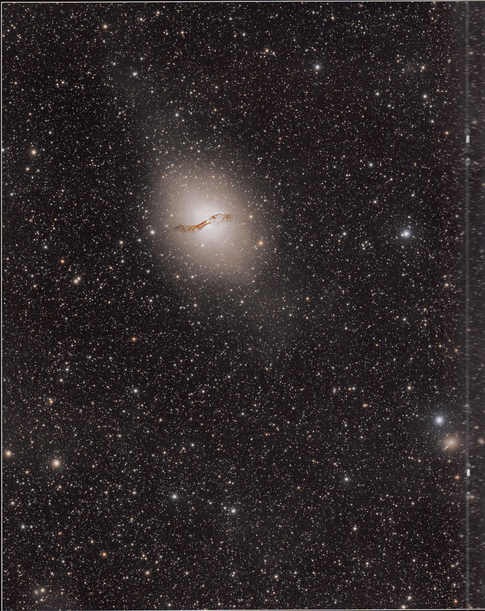
NGC 5128 (galaxie Centaurus A) imagée par l'APO-Team depuis leur observatoire au Chili, en mode "remote". Lunette TOA150 avec Focallens Alta U16M sur une monture Mini-OHP et MCMT. Filtres LRGB Gen.2 Astrodon. 24 poses de 20min pour la luminance et 6 poses de 20min en