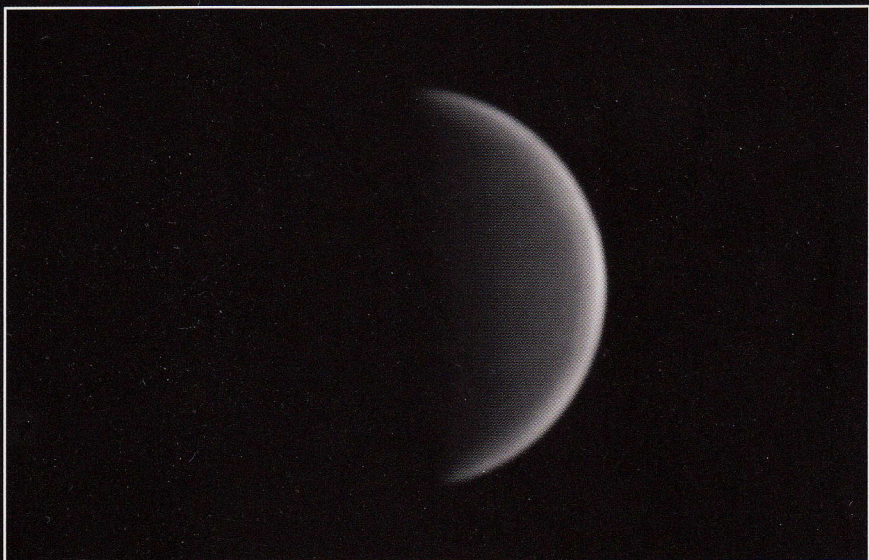
IR (filtre IR 742) 08/06/2015 19:22 TU